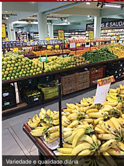
Variedade e qualidade diária

a trigo das melhores e mais tradicionais marcas para o público específico consumidor desses produtos. Os pets também têm produtos para eles.