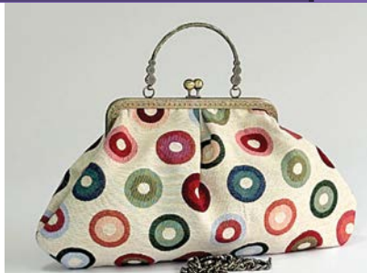
Bolsa Ana em jacquard

e através de um curso de Modelagem e Confecção de bolsas em 2006. “Desde então nunca mais consegui me imaginar trabalhando em outra área”, conta.