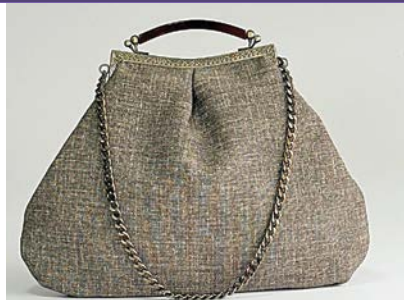
Modelo Alba em linho