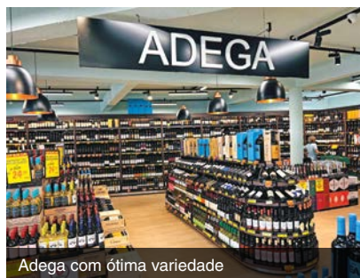
Adega com ótima variedade

Outros itens para casa como águas, refrigerantes, sucos naturais, bebidas alcoólicas e não alcoólicas, produtos voltados para veganos e pessoas com restrições