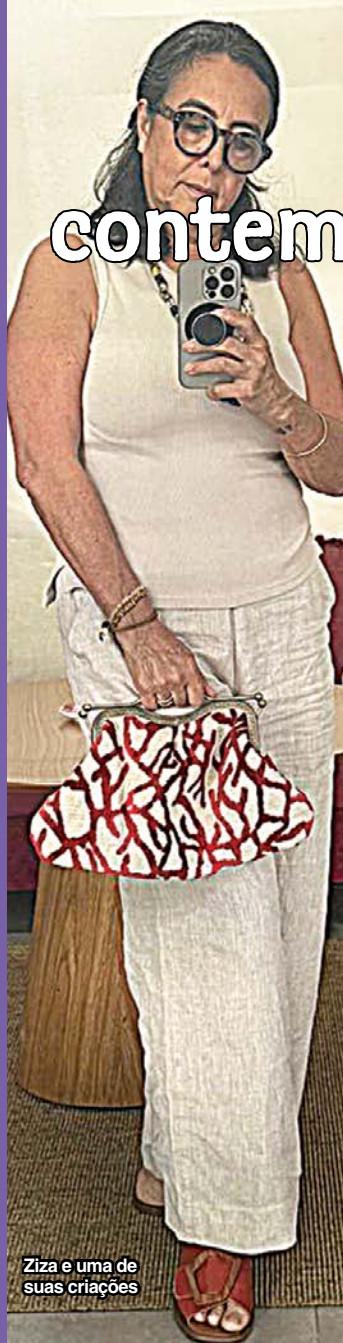
Ziza e uma de suas criações