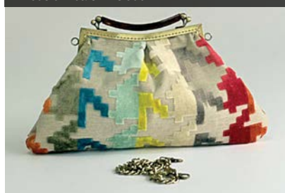
Modelo Alba em veludo

Domenica 112 Bolsas Rua Espártaco, 464, Vila Romana Telefone 97101-6632 @domenica_112