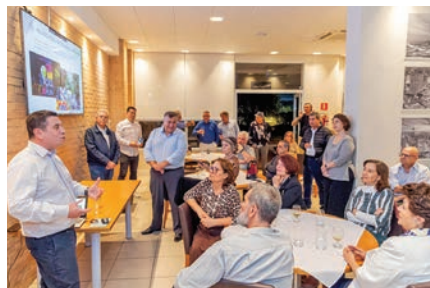
11ª apresentação da Associação Viva Leopoldina

assistenciais. “Além do PIU, estamos atuando em outra obra de impacto na Leopoldina, a parceria público-privada na área do antigo terreno da CMTC, onde estamos negociando uma área para abrigar um quartel dos bombeiros ou da