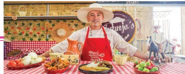
Perú é um dos melhores destinos culinários do mundo

O evento tem entrada gratuita e acontece das 13h às 20h na Ilha Musical do Parque Villa-Lôbos, entrada pelo Portão 3.